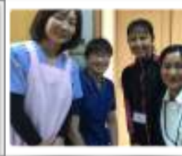
私たちが伺います