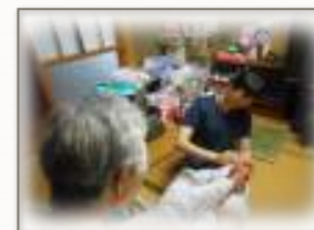
足のむくみが気になるかたへのオイルマッサージ