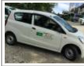
白い軽自動車でお伺います

私どもは、お客さまにとって「必要な時に必要なケア」をできる限りめざしています。夜間や休日に不安な症状や困りごとが起きた時、まずはお電話を承ります。そのうえで、訪問の必要があれば、時間をとわず伺います。（1割負担で）540円/月