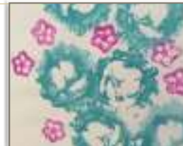
野菜の輪切りで絵葉書づくり