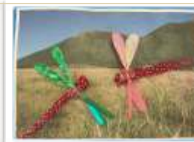
季節に応じた作品づくり