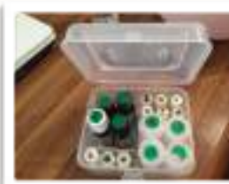
お好みの香りが楽しめます